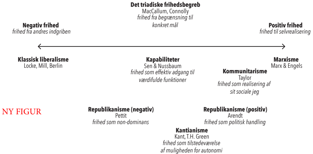
Figur 8.2. Opsummering og placering af forskellige frihedsopfattelser

Figur 8.2 giver et overblik over de forskellige frihedsopfattelser og et bud på deres placering i forhold til positiv og negativ frihed.